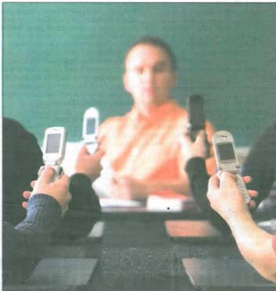
Les professeurs sont débordés par la charge de travail et n'ont pas toujours le temps de faire de l'éducation sexuelle. Les jeunes se tournent donc vers d'autres moyens de communication pour aller chercher de l'information.