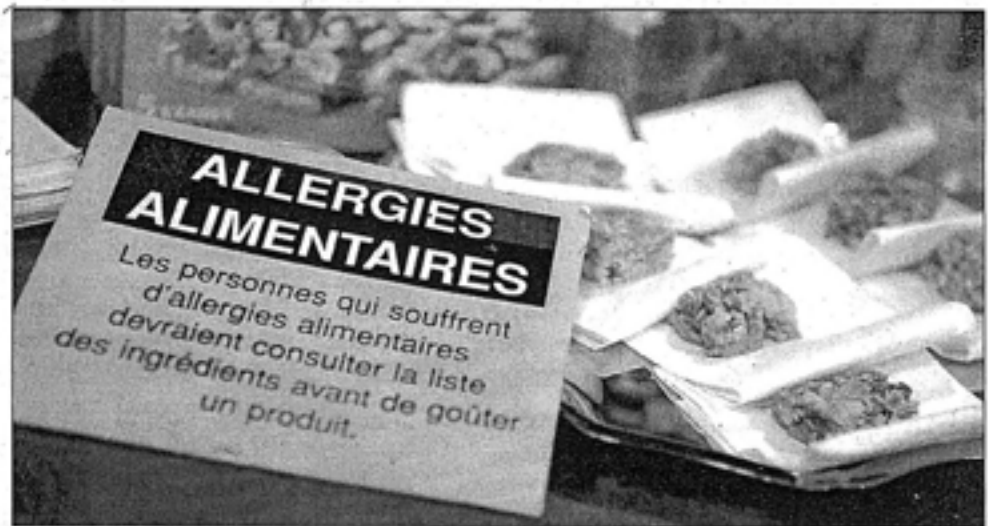
Les responsables de l'alimentation des CPE doivent prendre en compte les restrictions de tous les enfants quand vient le temps de préparer les repas.